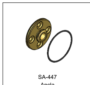
SA-447 Ancla Wall Bracket